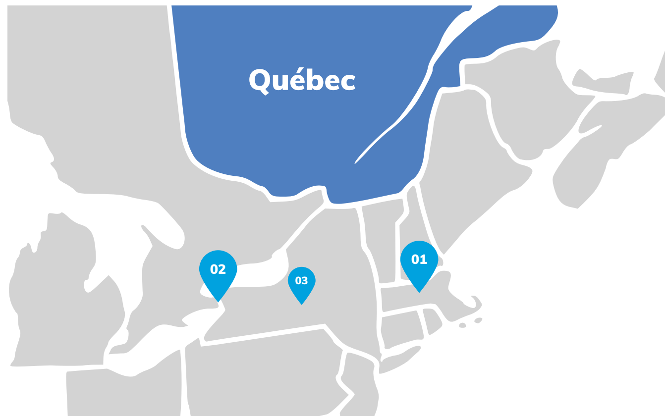
01 LEOMINSTER, MA