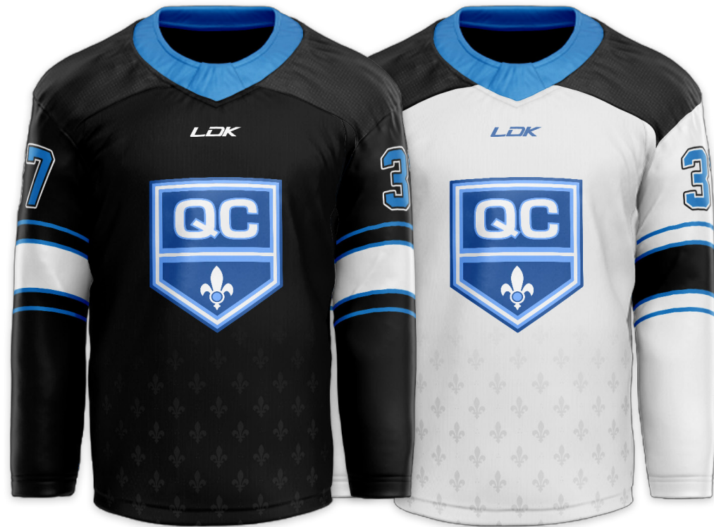
UNIFORMES DE MATCH